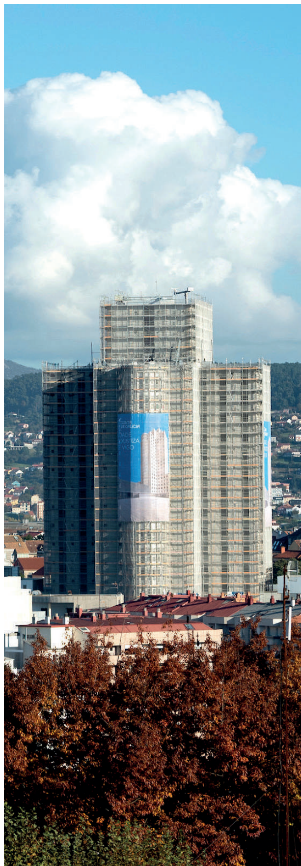
Edificio del antiguo Hospital Xeral de Vigo, donde se instalarán los juzgados y nueva sede del Colegio de Procuradores.

La comisión ha sido creada para dar contenido a la adhesión por parte del Colegio de Procuradores de Vigo al convenio suscrito por el Consello Gallego y la Xunta de Galicia para la tramitación de mediaciones en el ámbito judicial. Además se han formado comisiones que puedan cubrir las peticiones de mediación que puedan encargarse al Colegio de Vigo en función del protocolo firmado.