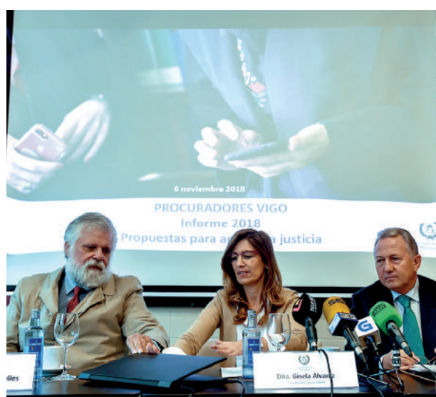
Presentación ante los medios del informe La justicia en Vigo