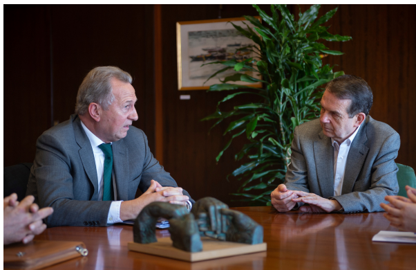
Los procuradores han mantenido reuniones con todos los grupos políticos con representación.

El Colegio de Procuradores de Vigo reúne a más de 150 profesionales (un 70% mujeres) con presencia en los partidos judiciales de O Porriño, Pontareas, Redondela, Tui y Vigo.