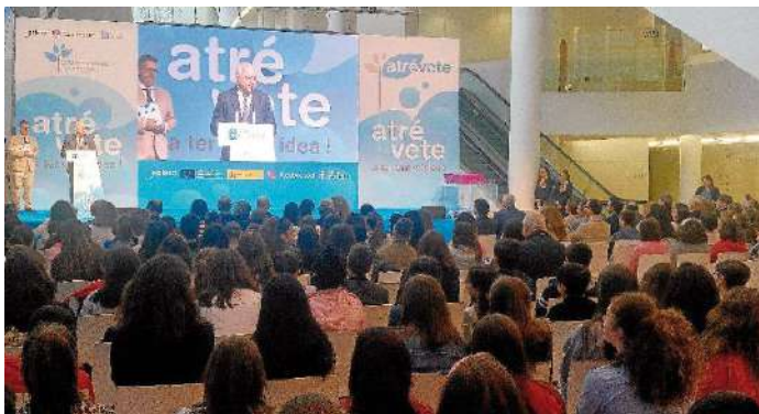
Entrega de premios do concurso 'Atrévete a ter unha idea' na Cidade da Cultura.

Creatividade, iniciativa ou responsabilidade. Foron algunhas das destrezas que demostrou o alumnado galego participante no concurso "Atrévete a ter unha idea", que se enmarca no Plan de Emprendemento do sistema educativo de Galicia, Eduemprende. A Cidade da Cultura acolleu onte a entrega dos premios outorgados no certame. En total foron 43 os estudantes que resultaron galardoados nesta edición dunha convocatoria cuxo obxectivo é fomentar, motivar, e sensibilizar no espírito emprendedor aos rapaces e rapazas de 5º e 6º de Primaria e 1º e 2º de ESO dos centros sostidos con fondos públicos.