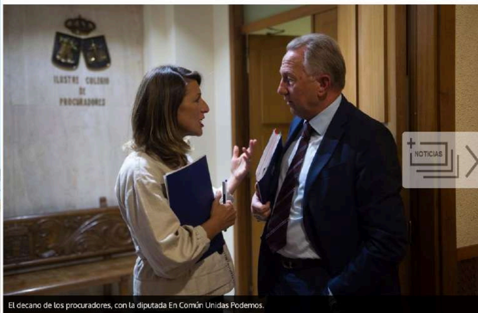
El decano de los procuradores, con la diputada En Común Unidas Podemos.

El Colegio de Procuradores de Vigo inició ayer un plan de encuentros con los representantes de todos los partidos políticos en el Congreso de los Diputados, con el objetivo de elevar una reforma legislativa que permita agilizar la Justicia, especialmente en el caso de Vigo.