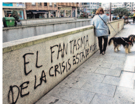
Pintada sobre el «fantasma de la crisis» en O Calvario.